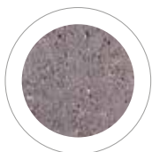
STALOWO-SZARY COLOR FLEX