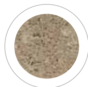
PIASKOWO-BEŻOWY COLOR FLEX