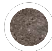
TORFOWY BRĄZ COLOR FLEX